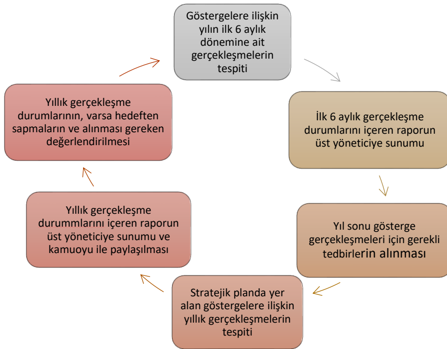
Şekil -2: İzleme ve Değerlendirme Modeli

Yılın tamamını kapsayan ikinci izleme dâhilinde; Müdürlüğümüz strateji geliştirme birimi tarafından performans programlarında yer alan performans göstergelerinin yılsonu gerçekleşme durumları tespit edilecektir. Yılsonu gerçekleşme durumları, varsa gösterge hedeflerinden sapmalar ve bunların nedenleri üst yönetici başkanlığında birim yöneticilerince değerlendirilerek gerekli tedbirlerin alınması sağlanacaktır.